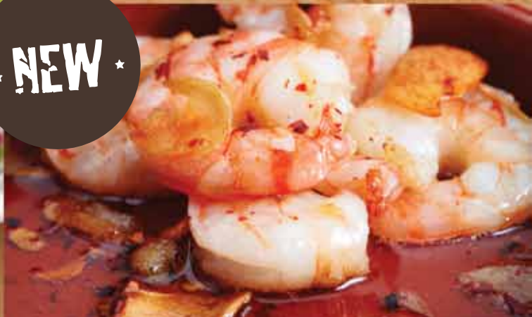
Bildene kan avvike noe i forhold til hvordan rettene serveres. The pictures may be slightly different than how the dishes are served.